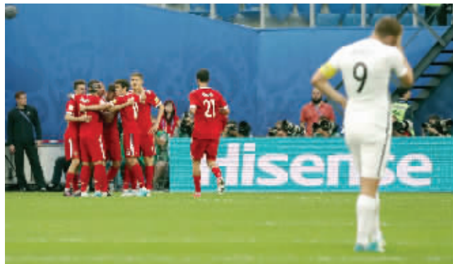
联合会杯赛场出现中国元素

前晚,国际足联联合会杯在俄罗斯圣彼得堡开幕。六大洲际冠军与世界杯冠军德国、东道主俄罗斯一同争夺四年一度的“王中王”奖杯。在揭幕战中,东道主俄罗斯凭借对方后卫的自摆乌龙和斯莫洛夫的进球,2:0战胜了大洋洲冠军新西兰。